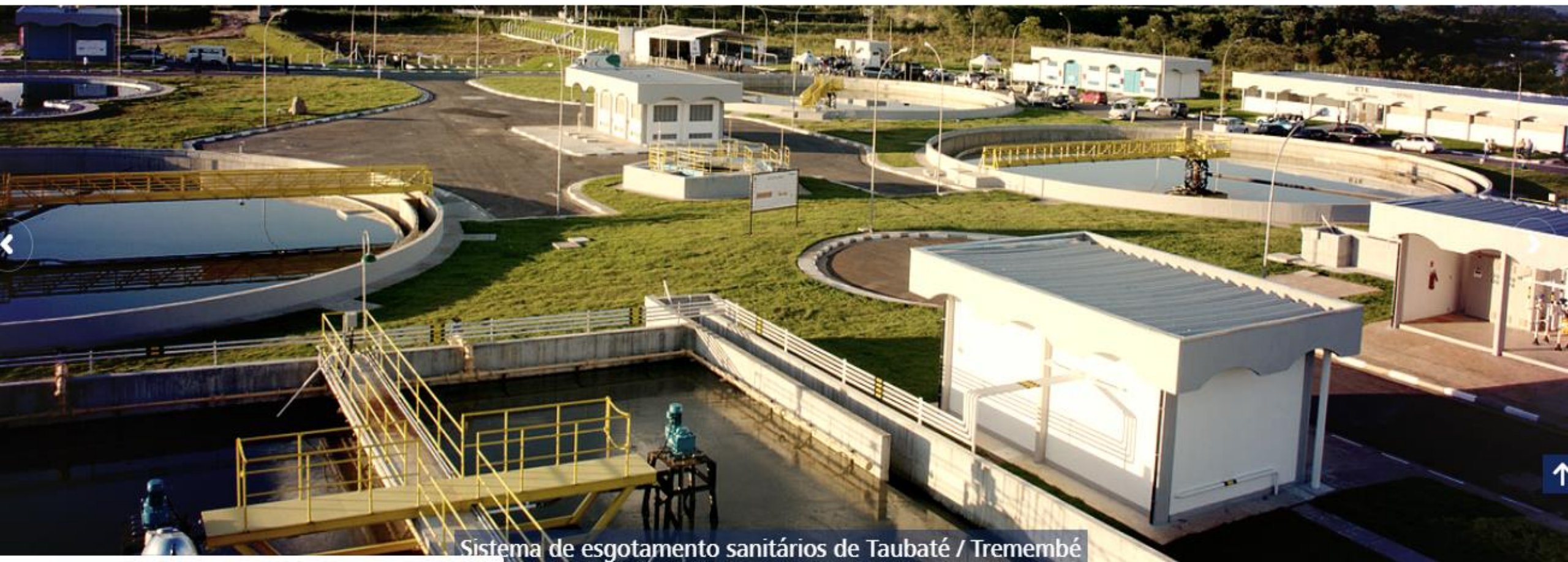
Sistema de esgotamento sanitários de Taubaté / Tremembé